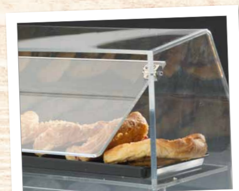
Art.-No. 9406003 *

* le clapet peut être commandé comme accessoire